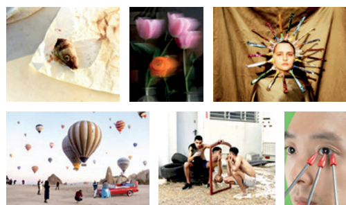
Afbeeldingen van Explore

ken, maar in wezen volledig losgekoppeld zijn van de werkelijkheid.' In Photography through the lens of AI verkent het fotomuseum in Amsterdam hoe de recente ontwikkelingen op het gebied van AI onze relatie met beelden en met onszelf en onze perceptie van de werkelijkheid beïnvloeden.