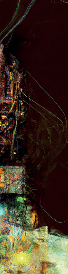
A self-portrait of an algorithm no. 52, 2023. Maria Mavropoulou, AI-generated image.

AI gegenereerde afbeeldingen die eruitzien als foto's terwijl er geen enkele camera bij aan te pas is gekomen. En in het thema Missing Viewer reflecteren kunstenaars op een van de meest bedreigende ontwikkelingen volgens Foam, namelijk het ontbreken van een menselijke kijker in het proces van beeldvorming: AI functioneert en observeert zelf, zonder menselijke tussenkomst.