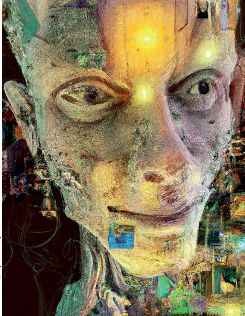
Maria Mavropoulou, AI-generated image

ingenieuze technieken in de donkere kamer tot de magie van programma's zoals Photoshop, aldus Foam. 'De meest recente ontwikkeling, AI, maakt het makkelijker dan ooit om beelden te creëren die verbazingwekkend "echt" lij-