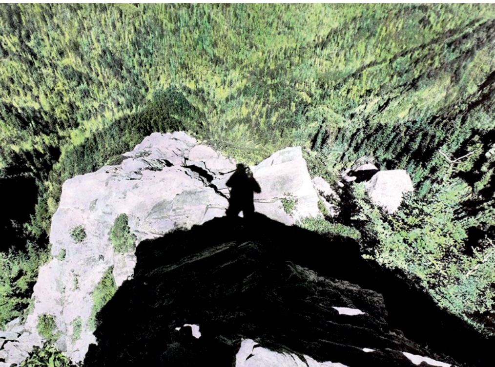
Vistas #22, 2020. Brea Souders.

> De groepstentoonstelling Missing Mirror is van 31 mei tot en met 11 september 2024 te zien in Foam, Paolo Cirio's AI Attacks van 31 mei tot en met 25 augustus 2024. <