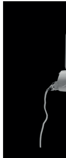
Beeld: Shadowtime & OurArk by Kathryn Hamilton en Deniz Tortum