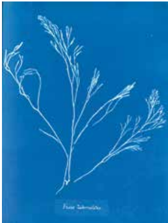
Een beeld uit het allereerste fotoboek (pagina 6)